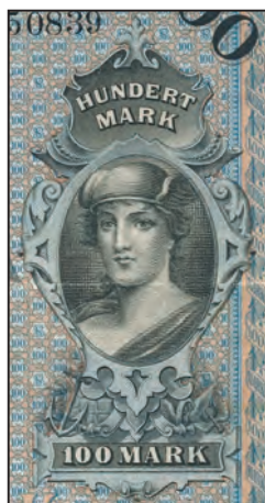
Ilustracja 2 b

W polu z lewej znajduje się ukazane z prawego profilu popiersie kobiety ubranej w ponadczasowe szaty i wieniec z liści dębu na głowie (il. 2 a). Ma ona włosy upięte z tyłu głowy. Na banknotach z 1874 roku na piersiach kobiety znajduje się medalion z literami „SB”, które są skrótem od nazwy banku – Sächsische Bank 24 . W związku z tym może być ona interpretowana jako personifikacja Saksonii. Poniżej portretu znajdują się przedmioty będące odwołaniami do gospodarki królestwa: pług, koło parowozu, koło zębate, kowadło, młot oraz obcęgi.