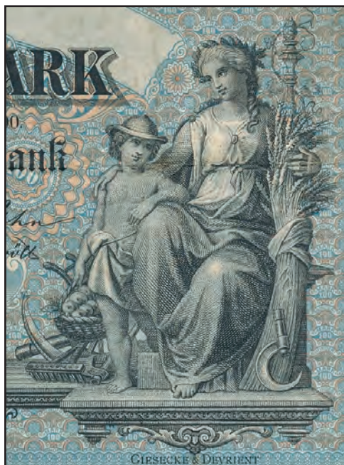
Ilustracja 1 b

Bawaria, 100 marek, 1 stycznia 1900 (detal awersu)