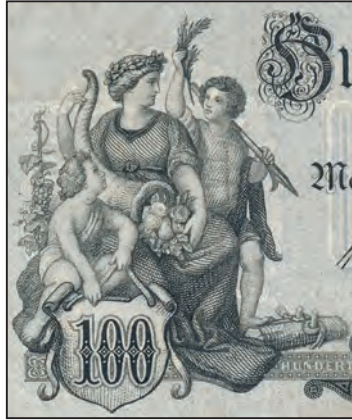
Ilustracja 6 a

Badenia, 100 marek, 1 stycznia 1907 (detal awersu)