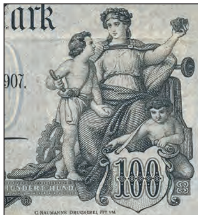
Ilustracja 6 b

Z lewej strony wkomponowana została ubrana w ponadczasowe szaty kobieta, która została ukazana w pozycji siedzącej (il. 6 a). Na jej głowie znajduje się wieniec z liści dębu. W rękach trzyma, skierowany wylotem do dołu, róg obfitości, z którego wysypują się płody rolne. Przy jej prawym boku siedzi chłopiec, który trzyma sznur od kartusza z wyrażoną za pomocą cyfr wartością nominału. Przy drugim boku kobiety został umieszczony stojący chłopiec, który w uniesionej do góry prawej ręce trzyma gałązkę palmową, a w drugiej ostrze wspartego na lewym ramieniu bosaka. Lewą stopę dziecko opiera o bal drewna. Za pośrednictwem rogu obfitości kobietę można utożsamiać z grecką boginią Tyche, obdarowującą księstwo pomyślnością. Obaj chłopcy zostali przedstawieni w ponadczasowych szatach ze wzrokiem skierowanym na kobietę.