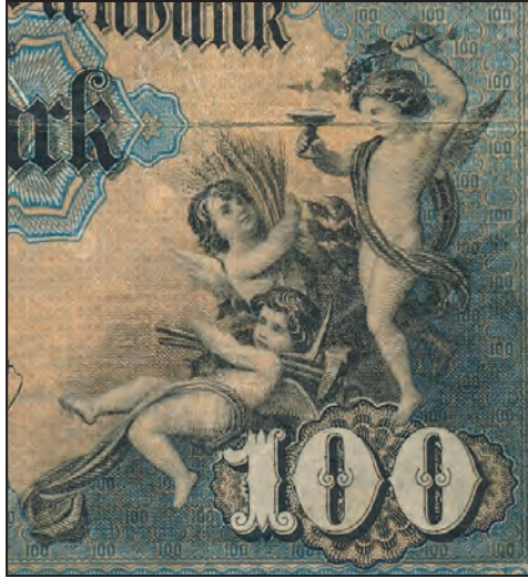
Ilustracja 3 b

W rękach trzyma kołowrotek do przędzenia nici. Postać ta jest interpretowana jako personifikacja rzemiosła. Trzecią postacią z tej grupy jest ukazane od tyłu putto, które ma na plecach parę skrzydeł. W rękach chłopiec trzyma książki i zwoje. Z jednego z nich zwisa przywieszona do dokumentu pieczęć. Postać ta jest interpretowana jako personifikacja nauki. Pomiędzy dwiema ostatnimi postaciami nawiązana została relacja wzrokowa.