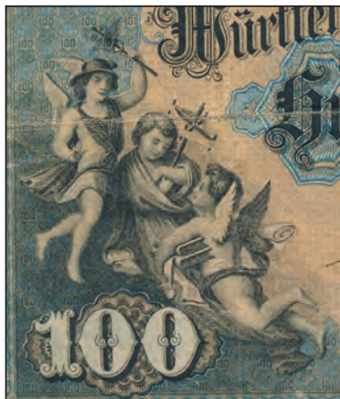
Ilustracja 3 a

koroną królewską na nim. Tarcza herbowa trzymana jest przez dwa wspięte na tylnych łapach zwierzęta. Z lewej strony znajduje się lew w zamkniętej koronie królewskiej na łbie, a z prawej jelen. Poniżej znajduje się winieta z dewizą – „furchtlos und trew.” [niem. nieustraszony i wierny].