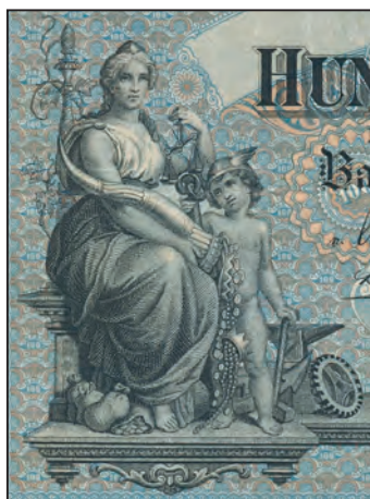
Ilustracja 1 a

Bawaria, 100 marek, 1 stycznia 1900 (awers)