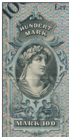
Ilustracja 2 a

Saksonia, 100 marek, 2 stycznia 1911 (detal awersu)