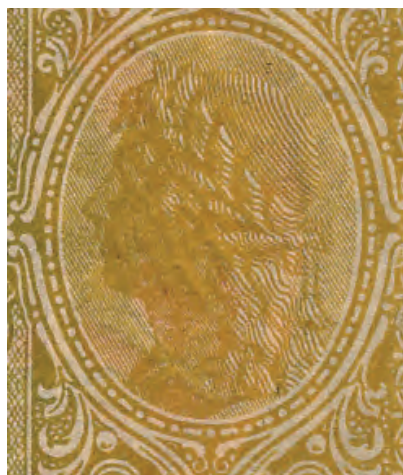
14. Detal z rewersu 1/2 marki polskiej, 9 grudnia 1916