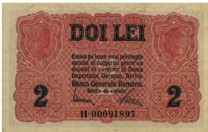
8. 2 lei [1917] (rewers)

awersu nominału 2 lei (il. 8) wkomponowane zostało ukazane z prawego profilu popiersie kobiety z włosami upiętymi w kok. Natomiast po przeciwnej stronie w owalnym polu umieszczona została głowa Merkurego w uskrzydłonej czapce. Na awersie 5 lei wkomponowano dwa kobiece popiersia z upiętymi z tyłu w kok włosami.