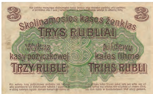
2 b. 3 ruble, 17 kwietnia 1916 (rewers)