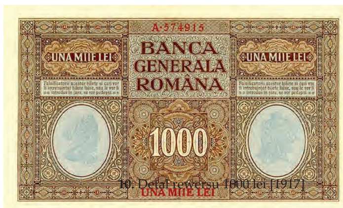
9. 1000 lei [1917] (rewers)

strzane odbicie tego portretu zostało umieszczone na rewersie 100 rubli emisji 17 kwietnia 1916 (por. il. 10 z il. 11) i 100 marek emisji 4 kwietnia 1918 roku, które były przeznaczone dla terenów Ober-Ostu. Natomiast w drugim medalionie umieszczona została głowa brodatego mężczyzny w czapce frygijskiej. Portret ten został wykorzystany później na awersie niemieckiego banknotu o nominale 500 000 marek emisji 1 maja 1923 roku, który trafił do obiegu w okresie hiperinflacji (por. il. 23 z il. 24).