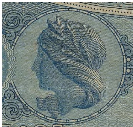
11. Detal rewersu 100 rubli, 17 kwietnia 1916