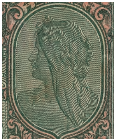
19. Detal z awersu 50 marek polskich, 9 grudnia 1916

Do ostatniej grupy należą dwa najwyższe nominały – 100 i 1000 marek polskich. Awersy tych pieniędzy papierowych zostały podzielone na trzy pola (il. 20 a i il. 25 a). W środkowej części zostały umieszczone informacje o nominale, a poniżej znalazła się czerwona winieta z pieczęcią Zarządu General-Gubernatorstwa Warszawskiego w otoczeniu dekoracji roślinnej. Wśród niej znalazły się dwa skierowane wylotami do dołu rogi obfitości. Z lewej strony awersu znajduje się stylizowany manierystyczny kartusz z wkomponowanym wewnątrz Orłem Białym na intensywnym czerwonym tle. Natomiast po przeciwnej stronie przedniej strony nominału w identycznym kartuszu, na czerwonym tle, została umieszczona wyrażona liczbowo wartość nominału. Na rewersach umieszczono symetrycznie dwa ośmiokątne pola ze zwróconymi ku sobie głowami (il. 20 b i il. 25 b). Na 100 markach polskich są to kobiece portrety w charakterystycznych hełmach, które można interpretować jako wizerunki Ateny. Natomiast na 1000 marek polskich umieszczono dwie różne głowy. W polu z lewej znalazło się popiersie Ateny w charakterystycznym hełmie oraz z włócznią. Projektujący banknot artysta, tworząc wizerunek bogini, najprawdopodobniej posiłkował się antyczną rzeźbą Atena Giustiniani (por. il. 20 b