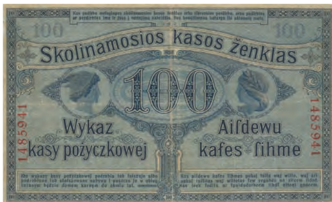
1 b. 100 rubli, 17 kwietnia 1916 (rewers)

tym razem w walucie markowej. Na banknotach tych zniknęły napisy w języku polskim. Zmieniono miejsce i datę emisji. Zamiast: Poznań, 17 kwietnia 1916 roku, umieszczono: Kowno, 4 kwietnia 1918 roku. Zmianie uległy również podpisy członków zarządu Kasy. Zachowano natomiast znaki wodne. Banknoty o nominałach 20 kopiejek i 1/2 marki zostały zabezpieczone bieżącym znakiem wodnym w postaci siatki zachodzących na siebie rombów. Wzór ten przypomina kolczugę. Nominały 50 kopiejek, 1 rubel oraz 1 i 2 marki mają znak wodny w postaci kótek i umieszczonych pomiędzy nimi czteroramiennych gwiazdek. Papier banknotowy, na którym zostały wydrukowane pieniądze pa-