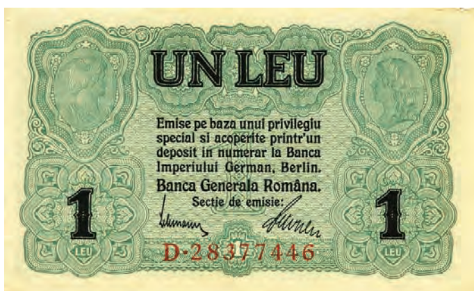
7. 1 lej [1917] (awers)

Do drugiej grupy zaliczają się trzy nominały: 1, 2 i 5 lei. W przypadku tych pieniędzy papierowych projektanci wkomponowali na awersach po dwa medaliony ze zwróconymi ku sobie popiersiami. W polu z lewej awersu banknotu o nominale 1 lej (il. 7) umieszczony został wizerunek Merkurego ubranego w chlamidę i uskrzydloną czapkę. Natomiast w polu z prawej znalazło się kobiece popiersie z długimi włosami przyozdobione wieńcem laurowym na skroniach. Z lewej strony