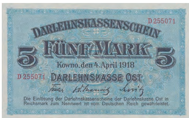
3 a. 5 marek, 4 kwietnia 1918 (awers)