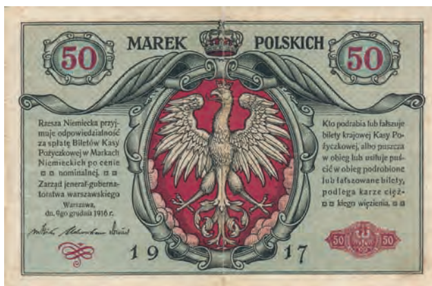
17 a. 50 marek polskich, 9 grudnia 1916 (awers)