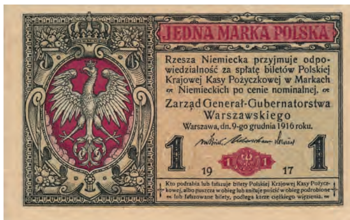
12 a. 1 marka polska, 9 grudnia 1916 (awers)

Zaprojektowane przez niemieckich grafików banknoty przeznaczone dla Polskiej Krajowej Kasy Pożyczkowej, podobnie jak banknoty Banca Generala Româna, można podzielić na trzy typy. Pierwszy z nich obejmuje trzy najniższe nominały: 1/2, 1 i 2 marki polskie, gdzie awers został podzielony na dwie części (il. 12 a). W węższej z nich, umieszczonej z lewej strony, wkomponowany został stylizowany manierystyczny kartusz ozdobiony ornamentami zwijającymi i zwieńczony zamkniętą koroną. W rogach tej części nominału zostały umieszczone kompozycje z owoców i liści, które pełnią funkcje dekoracyjne. Szersze pole zostało przeznaczone na informacje o nominale oraz klauzulę prawną. U góry znajduje się prostokątny kartusz ozdobiony ornamentami zwijającymi. Wewnątrz niego umieszczone zostało czerwone pole z wyraźną słownie wartością nominału. Natomiast rewersy (il. 12 b) zostały podzielone na trzy części. W polu środkowym znajduje się rysunek