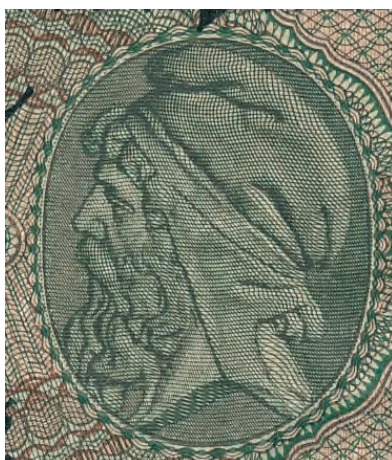
24. Detal awersu 500 000 marek, 1 maja 1923

Odrodzone 11 listopada 1918 roku Rzeczpospolita Polska początkowo nie dysponowała nawet namiastką własnego skarbu, w związku z tym była zmuszona tolerować krążącą w obiegu wprowadzoną przez Niemców walutę. Do 1924 roku polską walutą pozostała marka polska, której kurs był powiązany z marką niemiecką 46 . Odziedziczone po Ge-