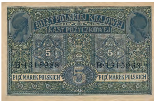
16 b. 5 marek polskich, 9 grudnia 1916 (rewers)