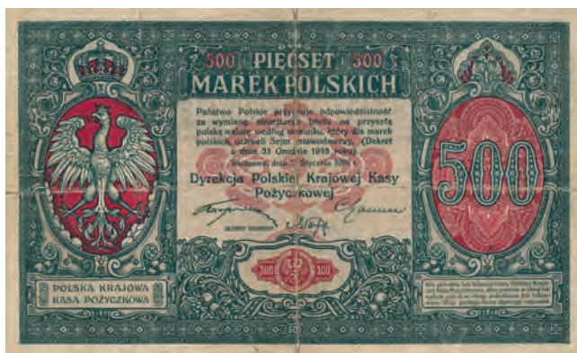
26 a. 500 marek polskich, 15 stycznia 1919 (awers)