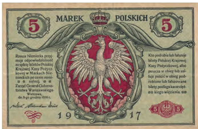
16 a. 5 marek polskich, 9 grudnia 1916 (awers)

i il. 17 a). Umieszczony u góry ornament zwijany rozchodzi się symetrycznie na boki. W górnych rogach, w mniejszych prostokątnych kartuszach, znalazła się wyrażona za pomocą liczb wartość nominału. Rewersy tych pieniędzy papierowych również zostały zakomponowane według jednego schematu (il. 16 b i il. 17 b). Na poszczególnych nominałach zmieniają się głowy umieszczone w medalionach oraz wyrażona słownie i liczbowo wartość nominału. Na rewersie 5 marek polskich zostały umieszczone kobiece głowy w charakterystycznych hełmach (il. 16 b). Obecność tego atrybutu pozwala interpretować te wizerunki jako przedstawienie Ateny. W szacie graficznej banknotów emitowanych przez Polską Krajową Kasę Pożyczkową o nominałach – 2, 10 i 20 marek polskich umieszczone są identyczne głowy. Natomiast na przeznaczony dla Generał-Gubernatorstwa Warszawskiego pięćdziesięciomarkówce wkomponowane zostały kobiece głowy zbliżone do popiersi przedstawiających Germanię na niemieckim banknocie o nominale 50 marek emisji 10 marca 1906 roku (por. il. 18 z il. 19) 44 . Na obydwu banknotach znalazły się portrety długowłosej kobiety z włosami spływającymi swobodnie na ramiona. Na jej skroniach umieszczone zostały wieńce z liści dębu. Zasadniczą różnicą w tych wizerunkach jest obecność stylizowanej Korony Cesarstwa Niemieckiego na głowie Germanii z banknotu o nominale 50 marek.