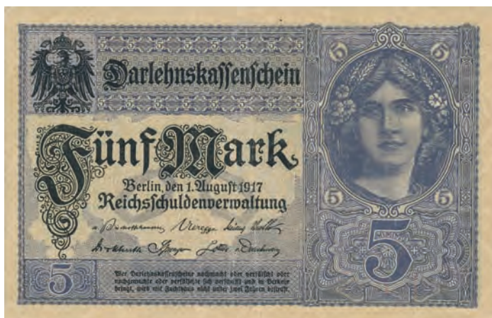
15. 5 marek, 21 sierpnia 1917 (awers)

Nominały 5, 10, 20 oraz 50 marek polskich reprezentują drugi typ użytego wzoru. Zmianie uległa dekoracja manierystycznego kartusza, który na tych nominałach jest centralnym punktem awersu (il. 16 a