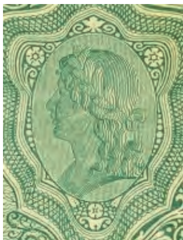
13. Detal z awersu 1 lej [1917]

a wyższemu do marek polskich. W przypadku banknotów przeznaczonych dla okupowanego terytorium Królestwa Rumunii oraz 5 marek w owalnym medalionie znalazło się popiersie, a poniżej gilosz z wyrażoną za pomocą liczby wartością nominału.