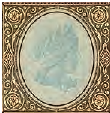
10. Detal rewersu 1000 lei [1917]