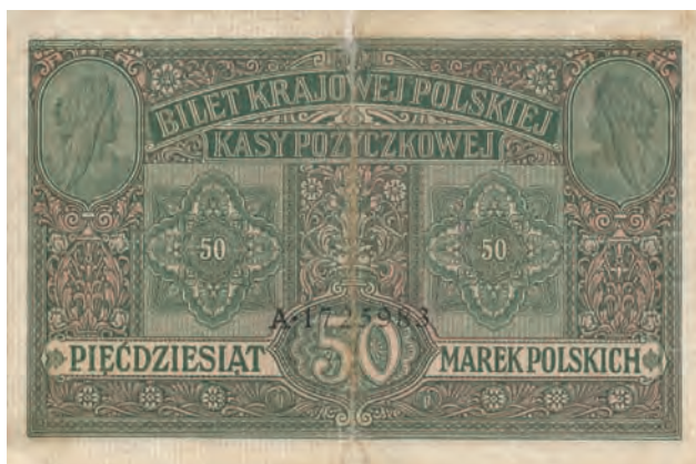
17 b. 50 marek polskich, 9 grudnia 1916 (rewers)