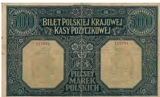
26 b. 500 marek polskich, 15 stycznia 1919 (rewers)