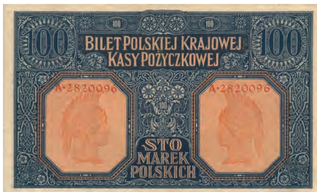
25 b. 100 marek polskich, 9 grudnia 1916 (rewers)