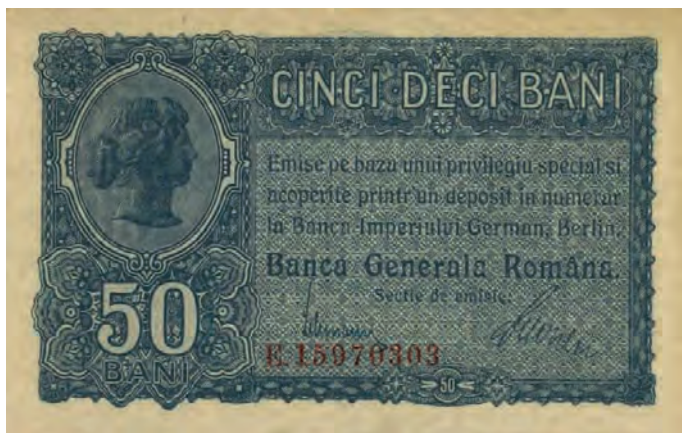
6. 50 bani [1917] (awers)