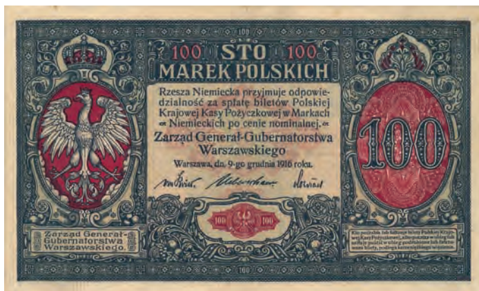
25 a. 100 marek polskich, 9 grudnia 1916 (awers)

nerał-Gubernatorstwie Warszawskim zapasy drukowanych w Berlinie marek polskich zostały w całości wprowadzone do obiegu. Brak dostatecznej ilości banknotów utrudniał zaspokajanie potrzeb Skarbu Państwa. Wobec niepowodzeń uzyskania w Berlinie znajdującego się tam zapasu banknotów oraz klisz, które pozwoliłyby na druk banknotów w kraju, dnia 31 grudnia 1918 roku dekretem Naczelnika Państwa upoważniono Polską Krajową Kasę Pożyczkową do druku banknotów wyłącznie o nominale 500 marek do kwoty 500 milionów marek polskich 47 . Żeby przyspieszyć proces tworzenia pieniędzy papierowych, pozostawiono szatę graficzną zaprojektowaną przez niemieckich projektantów dla banknotu o nominale 100 marek polskich (por. il. 30 a z il. 31 a oraz il. 30 b z il. 31 b). Wprowadzony do obiegu podczas pierwszej wojny światowej banknot o nominale 100 marek polskich posłużył jako pierwowzór dla pierwszego w odrodzonym państwie polskim banknotu o nominale 500 marek polskich emisji 15 stycznia 1919 roku. Tworząc ten nominał, pozostawiono szatę graficzną, lecz zmieniono wartość nominalną, podpisy oraz klauzulę prawną, w której to Państwo Polskie, a nie Rzesza Niemiecka, zobowiązywało się do jego wymiany na przyszłą polską walutę. Zmianie uległ również znak wodny 48 .