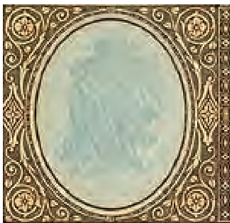
23. Detal rewersu 1000 lei [1917]