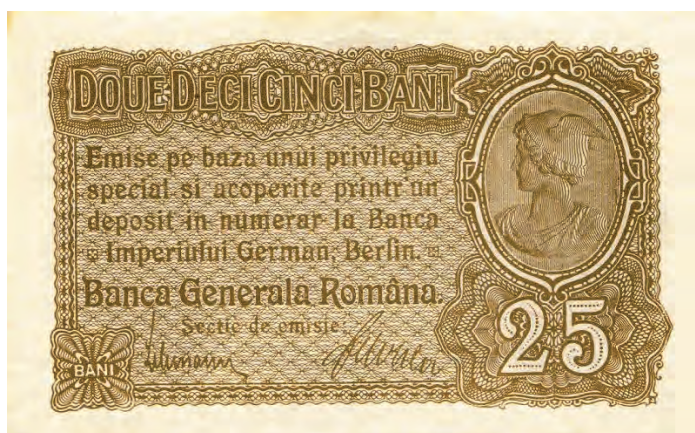
5. 25 bani [1917] (awers)

Wyemitowane przez Banca Generala Româna banknoty pod względem stylistycznym można podzielić na trzy grupy. Pieniądze papierowe należące do pierwszej z nich charakteryzują się obecnością jednego medalionu z profilowo ukazaną głową na awersie. Do grupy tej należą dwa najniższe nominały – 25 i 50 bani. Z prawej strony awersu 25 bani (il. 5) zostało wkomponowane ukazane z lewego profilu popiersie Merkurego w uskrzydłonej czapce oraz spiętej na lewym ramieniu chlamidzie 23 . Natomiast z lewej strony awersu nominału 50 bani (il. 6) została wkomponowana kobieca głowa ukazana z prawego profilu.