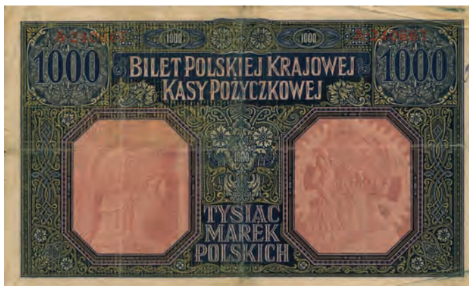
20 b. 1000 marek polskich, 9 grudnia 1916 (rewers)