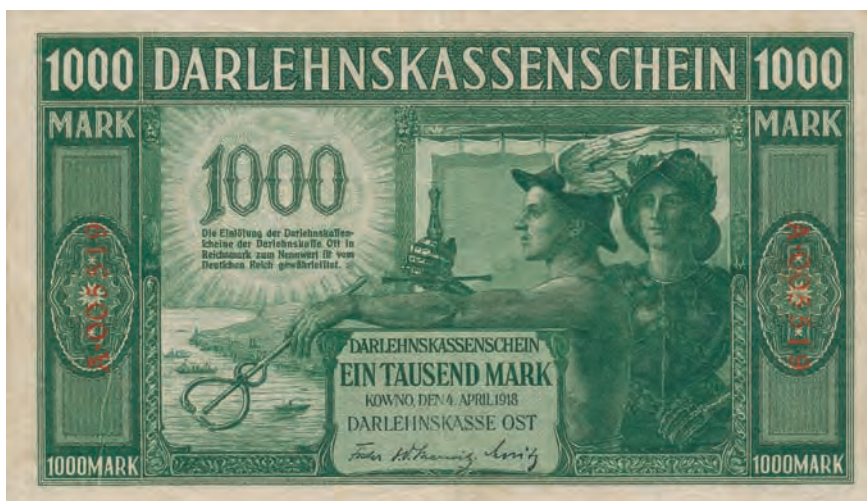
4 a. 1000 marek, 4 kwietnia 1918 (awers)

wym. W zabudowie miejskiej wyróżnia się bryła kościoła. Za miastem, na wysuniętym w morze cyplu, znajduje się latarnia morska. Natomiast w zatoce płyną trzy statki. Przedstawionych na awersie mężczyzn można interpretować jako strażników rozwoju handlu lokalnego oraz mieszkańców tego terenu. A wschodzące słońce jako symbol nowego porządku, który nastął wraz z przesunięciem się frontu na Wschód. Przedstawienie mężczyzn w średniowiecznej stylistyce nie jest wyjątkowe w przypadku pieniędzy papierowych emitowanych w Cesarstwie Niemieckim. Na 20 markach emisji 11 lipca 1874 roku znalazł się wizerunek średniowiecznego herolda. Natomiast na 5 markach emisji 10 stycznia 1882 roku ubrany w zbroję turniejową rycerz 15 . Tylna strona banknotu 1000 marek emisji 4 kwietnia 1918 roku (il. 4 b) została podzielona pionowym pasem na dwie w miarę równe części. W większym z nich, umieszczonym z prawej strony, znalazła się wypisana po litewsku i łotewsku klauzula prawna. Pole to zostało ozdobione ornamentem roślinnym. W drugim polu projektant tego nominału umieścił widzianą od pasa w górę postać ubranej wspólnie młodej dziewczyny. Odziana w jasną, zwiewną bluzkę kobieta została ukazana frontalnie, z głową zwróconą w lewo. Związane z tyłu głowy włosy oraz oparty o prawe ramię młotek i trzymane w lewej