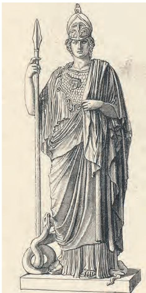
21. Atena Giustiniani (rysunek)