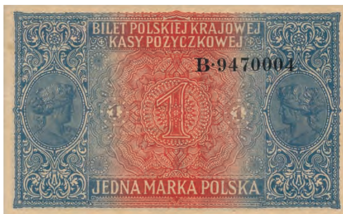
12 b. 1 marka polska, 9 grudnia 1916 (rewers)