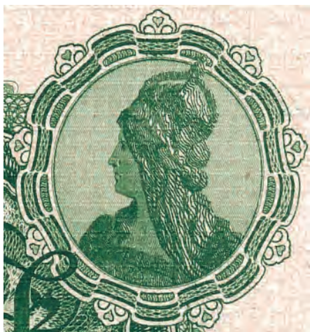
18. Detal z rewersu 50 marek, 10 marca 1906