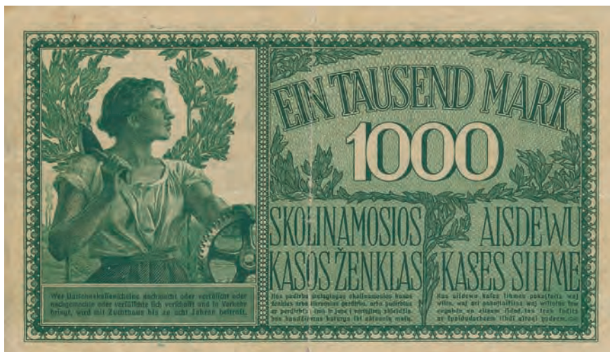
4 b. 1000 marek, 4 kwietnia 1918 (rewers)

ręce koło zębate pozwalają interpretować tę postać jako personifikację przemysłu. Głowa kobiety umieszczona została w swoistym nimbie, który tworzy wyrastający z za pleców kobiety wieniec laurowy. W tle zostały wkomponowane pola uprawne oraz dymiące kominy fabryczne.