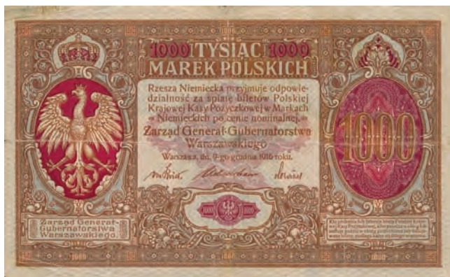
20 a. 1000 marek polskich, 9 grudnia 1916 (awers)

z il. 21) 45 . Po przeciwnej stronie tylnej strony banknotu wkomponowane zostało ukazane z lewego profilu popiersie brodatego mężczyzny w czapce frygijskiej na głowie (il. 22). Tłem dla przedstawienia męskiej głowy jest koło zębate. Na lewym ramieniu mężczyzny można dostrzec fragment fartucha. Zespół atrybutów w postaci fartucha i koła zębatego pozwala interpretować popiersie brodatego mężczyzny jako wizerunek Hefajstosa – antycznego boga patrona rzemieślników. Jednak czapka frygijska na głowie mężczyzny nie występuje na wizerunkach bóstw starożytnej Grecji i Rzymu. Spotykana jest raczej u bóstw z Bliskiego Wschodu. Po rewolucji francuskiej czapka frygijska stała się symbolem wolności. W związku z tym przedstawienie to można interpretować jako personifikację przemysłu. Podobny męski portret został umieszczony na banknocie o nominale 1000 lei, który był w obiegu na okupowanych przez wojska państw centralnych terenach Królestwa Rumunii oraz na wyemitowanych w okresie hiperinflacji w Republice Weimarskiej nominale 500 000 marek emisji 1 maja 1923 roku (por. il. 22 z il. 23 oraz il. 24). Na nominale 1000 marek polskich przedstawienie mężczyzny zostało rozbudowane o koło zębate oraz fartuch.