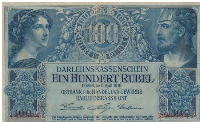
1 a. 100 rubli, 17 kwietnia 1916 (awers)