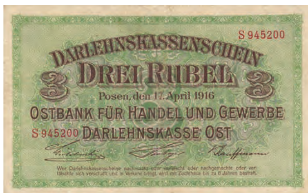
2 a. 3 ruble, 17 kwietnia 1916 (awers)

Mająca siedzibę w Kownie Wschodnia Kasa Pożyczkowa wpuściła do obiegu osiem różnych nominałów pieniędzy papierowych: 1/2, 1, 2, 5, 20, 50, 100 oraz 1000 marek. Marki te przeszły do historii jako „ostmarki” lub „marki wschodnie”. Przy projektowaniu tych „wykazów” posłużono się szatą graficzną ostrubli. Wskazuje to na jednego projektanta lub grupę projektantów tworzących projekty „wykazów Wschodniej Kasy Pożyczkowej” w rublach i markach. Nominały od 1/2 do 50 marek są z obydwu stron zdobione rysunkiem ornamentalnym. Szata graficzna nominału 5 marek została delikatnie przetworzona na potrzeby tego banknotu z 3 rubli (por. il. 2 a z il. 3 a oraz il. 2 b z il. 3 b). Podobna sytuacja miała miejsce w przypadku par banknotów 20 marek i 10 rubli oraz 50 marek i 25 rubli. W przypadku nominału 100 marek zmianie uległ kolor szaty graficznej banknotu z ciemnoniebieskiego na brązowy. Usunięto klauzulę prawną w języku polskim, lecz pozostawiono ogólny rysunek obydwu stron z postaciami mitologicznych bóstw.