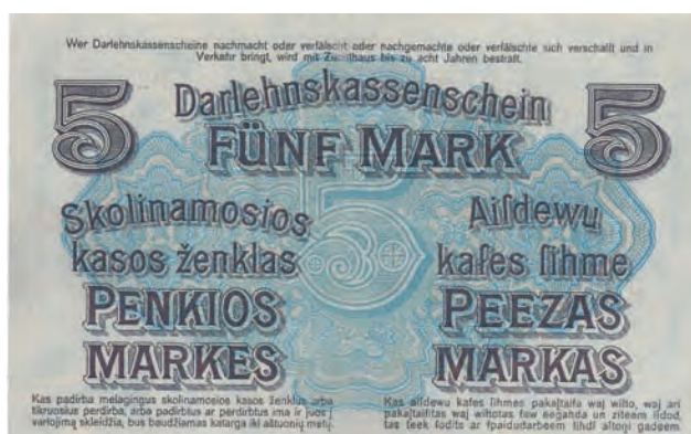
3 b. 5 marek, 4 kwietnia 1918 (rewers)